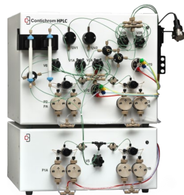
ChromaCon 製「Contichrom」 (ChromaCon はワイエムシィのグループ会社です)